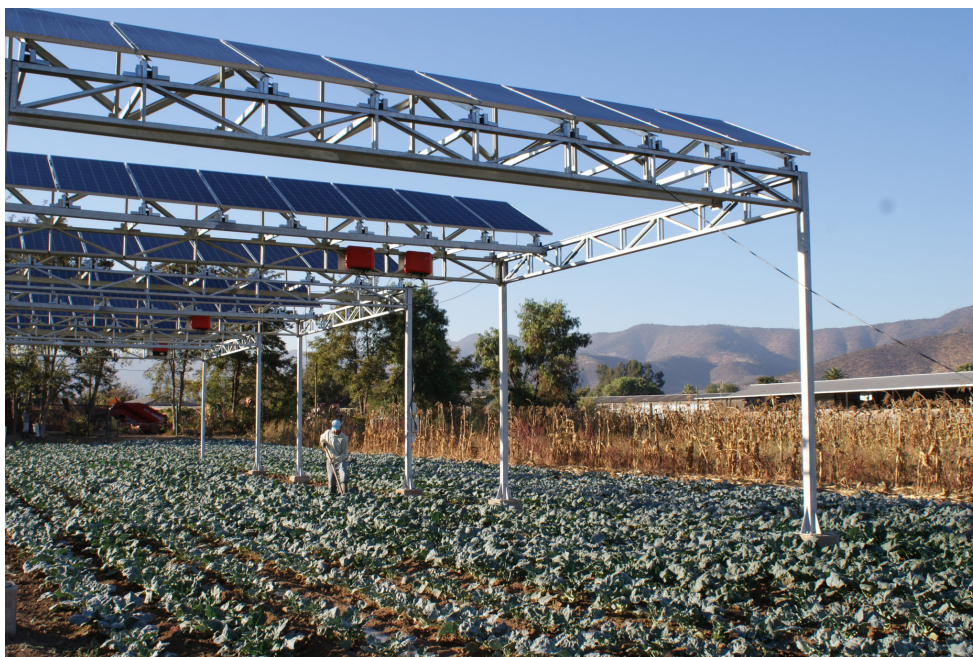
Figura 2: Sistema AgriPV con módulos monofaciales y altura libre desarrollado en el proyecto FIC-R 2015 CÓDIGO BIP 30449383-0 por Fraunhofer Chile Research. En el proyecto, financiado por el Gobierno Regional Metropolitano de Santiago, se implementaron tres proyectos piloto en colaboración con agricultores del sector de la horticultura en Lampa, Curacaví y El Monte (Fraunhofer Chile Research, 2018).