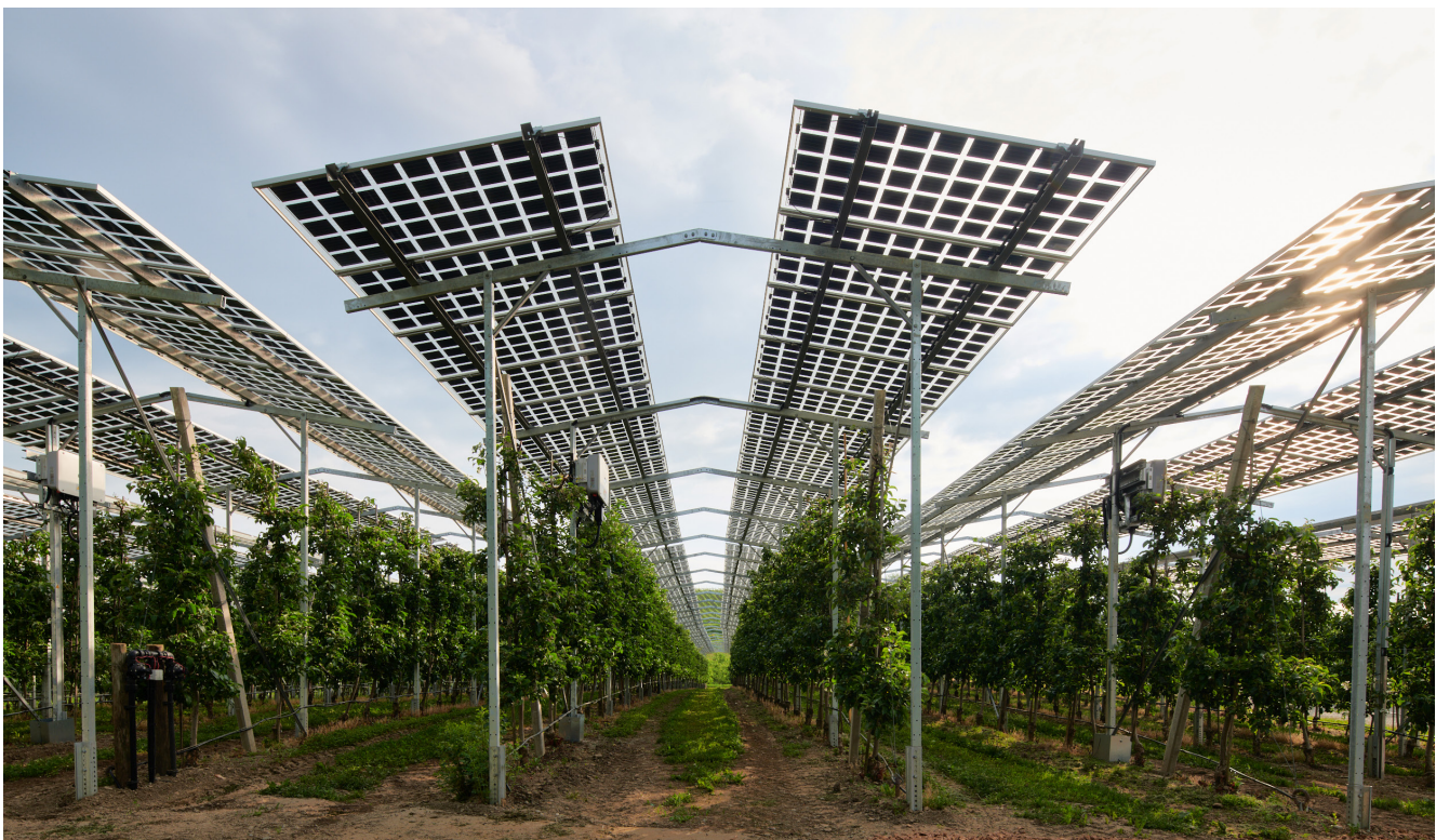
Figura 1: Instalación de AgriPV con módulos semitransparentes sobre huertos de manzanos, parte del proyecto de investigación “Región Modelo de Baden-Wurtemberg”, Fraunhofer-Institut für Solare Energiesysteme ISE. (s.f.). En este proyecto se investiga integralmente el potencial de la AgriPV en el sur de Alemania mediante la implementación de una variedad de proyectos piloto.

En este sentido, el diseño de un sistema AgriPV debe estar enfocado principalmente en la agricultura, con un rol secundario en la generación de energía.