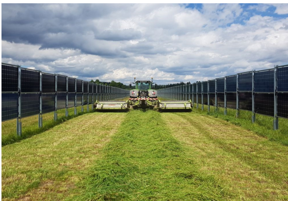
Figura 3: Sistema AgriPV comercial con módulos bifaciales y en disposición vertical de 4,1 MWp de la empresa Next2Sun GmbH en Donaueschingen, Alemania, combinado con la producción de heno (Enkhardt et al., 2020).

En general, se puede observar que los sistemas AgriPV poseen diseños adaptados a los cultivos. En las Figuras 1 y 2 se aprecia un ejemplo de sistema denominado con altura libre de los paneles FV, con tal de generar un microclima específico y proteger a los árboles de granizo y lluvias intensas. Por otro lado, existe el diseño del sistema entre hileras, permitiendo el uso de maquinaria agrícola entre los paneles FV. La Figura 3 presenta un sistema AgriPV vertical, que habilita la producción y cosecha de heno entre las hileras de paneles.